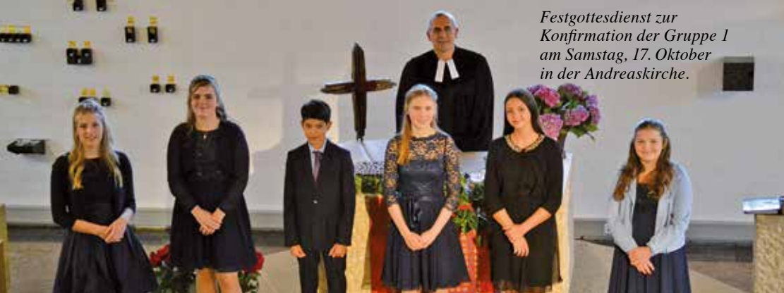
Festgottesdienst zur Konfirmation der Gruppe 1 am Samstag, 17. Oktober in der Andreaskirche.