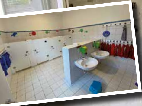
ARCHE BAUABSCHNITT 1