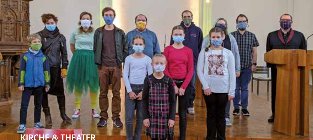
KIRCHE & THEATER