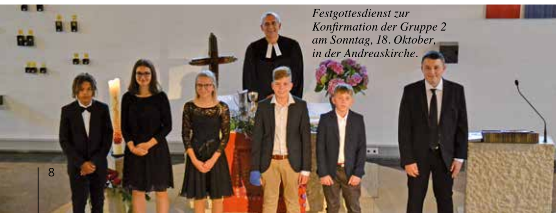
Festgottesdienst zur Konfirmation der Gruppe 2 am Sonntag, 18. Oktober, in der Andreaskirche.

Der Konfirmandenunterricht mit den Neuen läuft bereits seit einem halben Jahr.