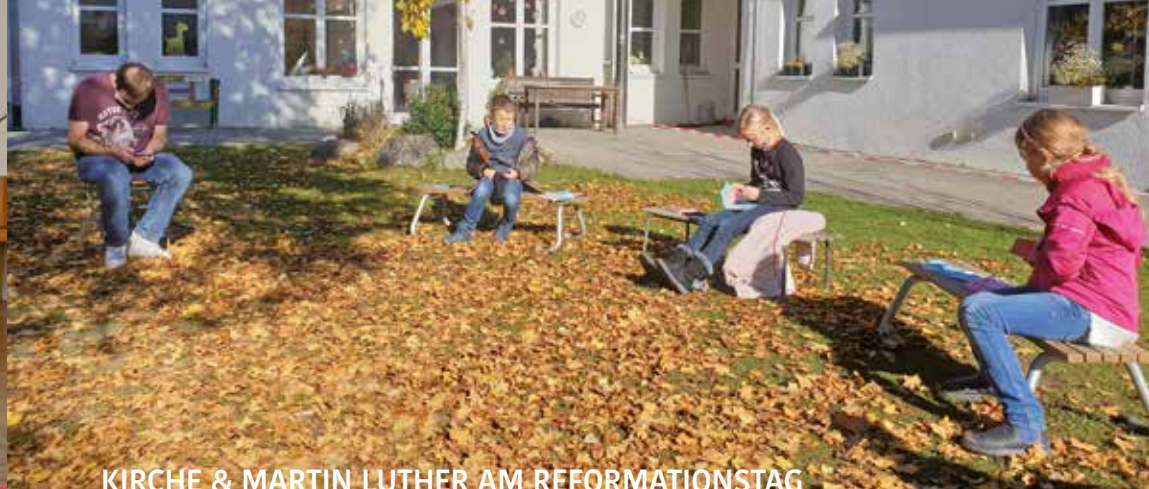
KIRCHE & MARTIN LUTHER AM REFORMATIONSTAG

Besonders schön war es, dass wir trotz aller strengen Corona-Bedingungen Gottesdienst mit Jung und Alt feiern konnten.